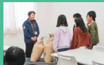
湖東第一小学校児童会様より、学校で育てたお米をご寄付いただきました。