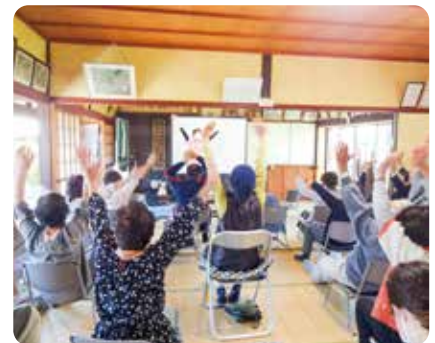
▲サロン活動の支援

今年度、3,000円以上賛助会費にご協力いただきました企業・法人・団体様のご芳名を記載させていただいています。