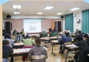
11月～12月 くらしの支え合いサポーター講座

私たちの周りには、ゴミ出しや、買い物、子どもの見守り、話し相手などちょっとした手助けがあれば、安心して暮らせる方がたくさんおられます。