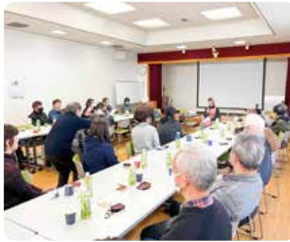
▲地区社会福祉協議会の活動支援