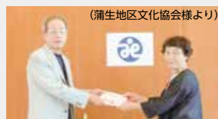
(蒲生地区文化協会様より)

前回お米のご寄付を呼びかけたところ、たくさんの方からお米をいただきました。ご寄付いただいた皆様ありがとうございました。