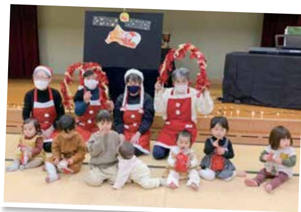
(親子と一緒に楽しめるクリスマス会)

高齢者のみならず親子連れも参加しやすい日にしようと、ひばり公園や湖東図書館など他の施設が休みの火曜日に開催をしています。