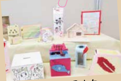
10月～1月中旬 アイデア募金箱の設置

先日、訪問した際に園児さんからお礼のお手紙をいただきました。代表の方が受け取って、デイサービスの皆さんに手紙を読んで頂くと「嬉しくて涙が出るな〜」「また頑張る作るわ」と言っておられました。また来月に行くのが楽しみです。