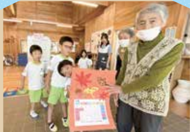
10/11 デイサービスからお届け

デイサービスセンターゆうあいの家では、もみじ幼稚園の皆さんにデイサービスの利用者様が作った雑巾やカレンダーなどを毎月届けに行っています。