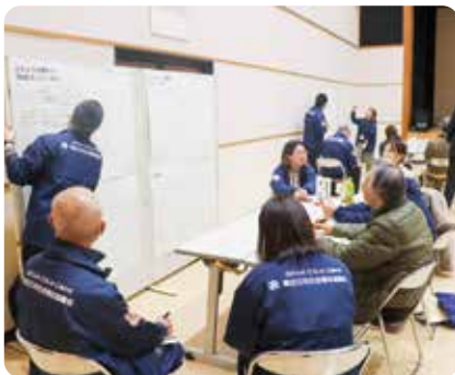
▲第3次地域福祉活動計画推進