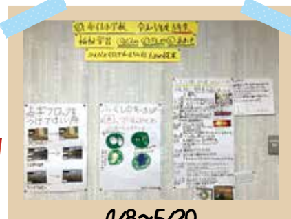
4/8～5/20 みんなが住みよいまちづくり

「とまる」「みる」「まつ」3つのお約束で、交通事故等のない安全で楽しい学校生活が送れるようにとびたくんと一緒に見守っていきたいと思います。