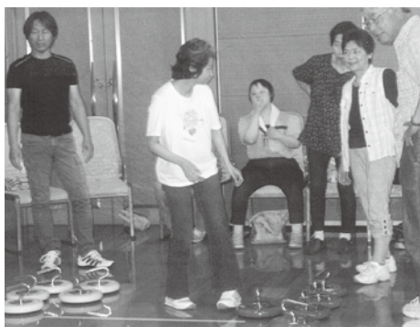
マイルド五個荘とのスポーツ交流会